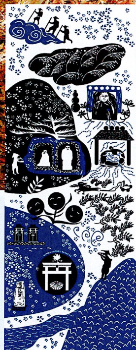
世界遺産登録20周年記念 大日山周遊手ぬぐい

熊野本宮語り部の会では、大日山周遊ルートウォークを毎月第3土曜に開催します。全参加者に世界遺産登録20周年を記念して作成した大日山周遊ルートオリジナルの手ぬぐいをプレゼントいたします。