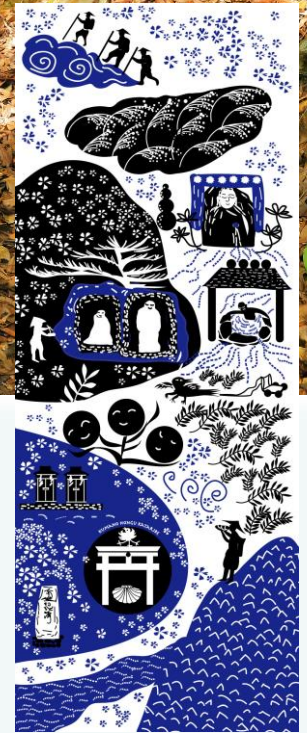
世界遺産登録20周年記念 大日山周遊手ぬぐい

熊野本宮語り部の会では、大日山周遊ルートウォークを毎月第3土曜に開催します。全参加者に世界遺産登録20周年を記念して作成した大日山周遊ルートオリジナルの手ぬぐいをプレゼントいたします。